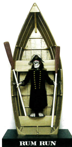
Robert Indiana, Rum run , 1975 ca. / 2005 ca., piccola barca a remi, legno, vernice dorata, resina, fibra ottica, lana, uniforme "Odd Fellows" 325,1 x 134,6 x 45,7 cm.